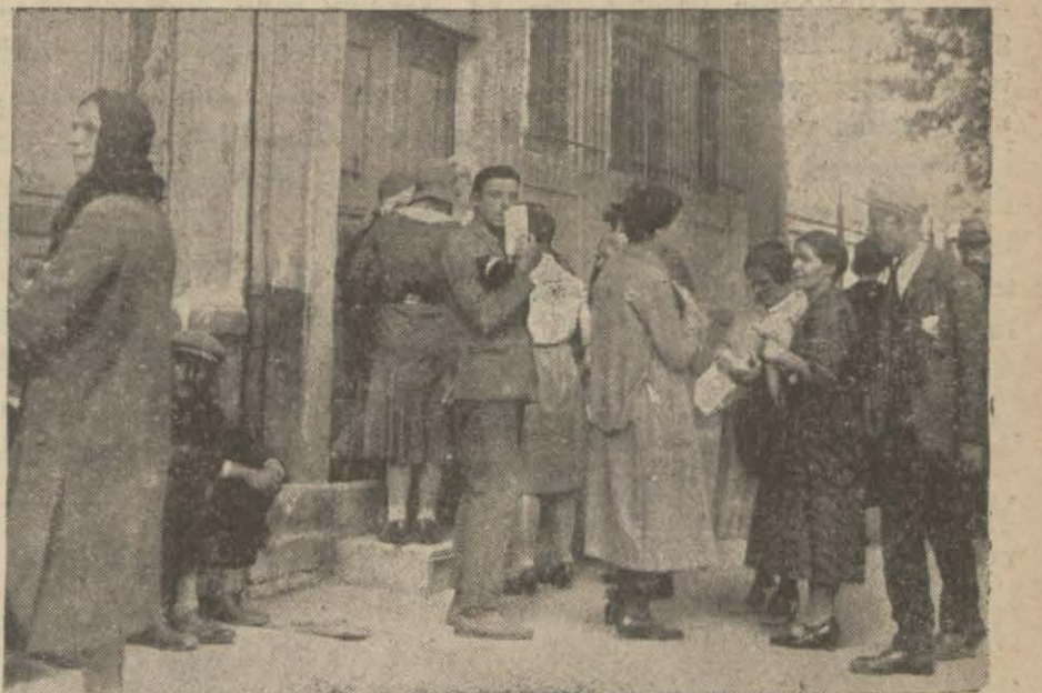
Kadın, erkek bir iş isteyici katile nöbet bekliyor

İçtimai dertlerimiz arasında hizmetçilik meselesi de dikkatle tetkik edilecek bir meseledir. Muharrirlerimizden Meliha Avni Hanım bu meseleyi esaslı şekilde tetkik etti. Birkaç gündür bu tetkik yazılarını neşrediyoruz. Bugünkü kısım bir genç kızın felâketini anlatıyor: