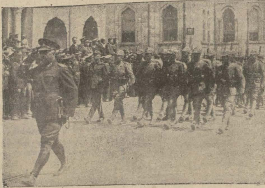
Bu sabahki merasimde: Kahraman ordumuzdan bir kıt'a

Dumlupınarda Mukaddes Şehitlerimiz Hatıraları Taziz Ediliyor