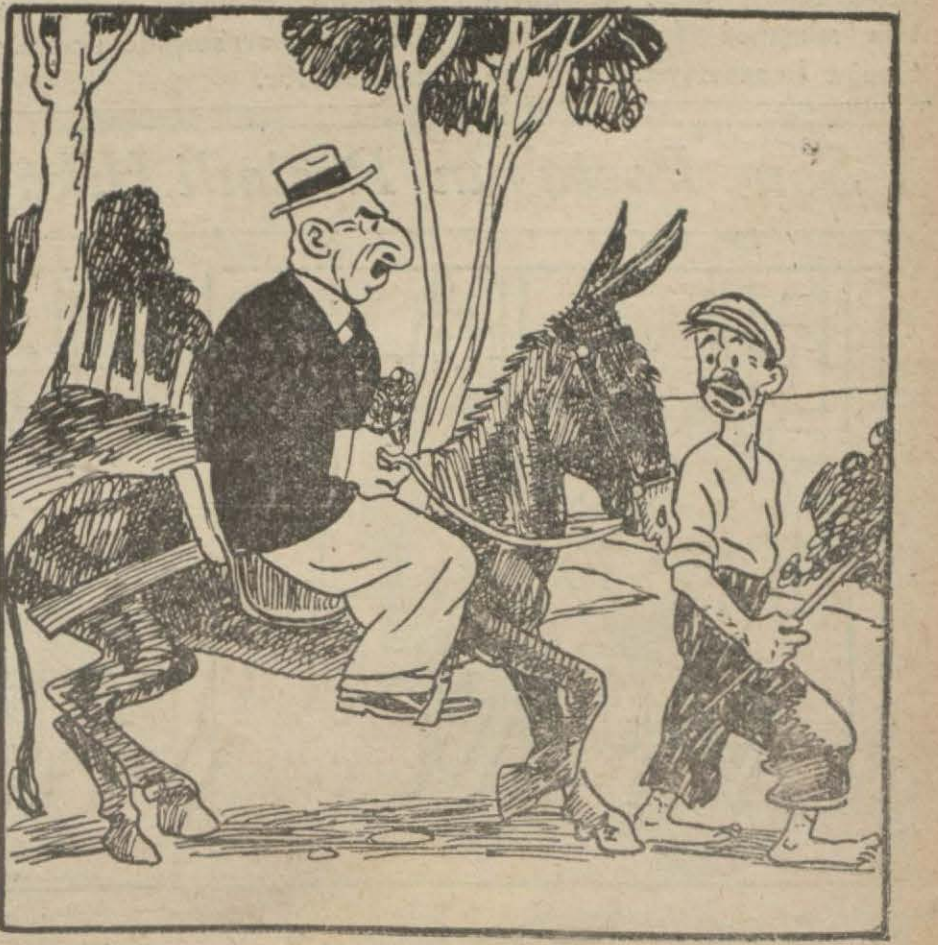
— (Ağız alışkanlığı ile) Şoför, Nizam caddesine çek.